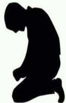
Bill W., cofundador de A.A.

Cuando el alcohol me hizo postrar de rodillas, me preparó para pedir el don de la fe. Y todo fue transformado. Nunca más, a pesar de mis dolores y mis problemas, experimentaría el desconsuelo de los años anteriores. Vi el universo iluminado por el amor de Dios. Ya no estaba solo.